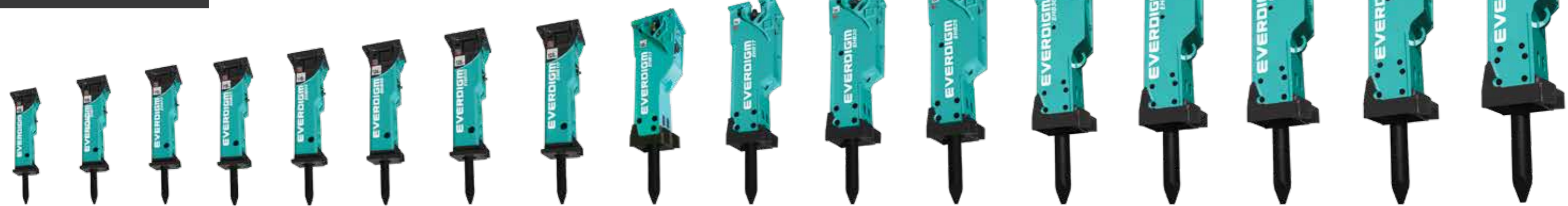
EHB008 EHB01 EHB02 EHB03 EHB04 EHB05 EHB06 EHB10 EHB13 EHB17 EHB20 EHB25 EHB30 EHB40 EHB50 EHB70 EHB100